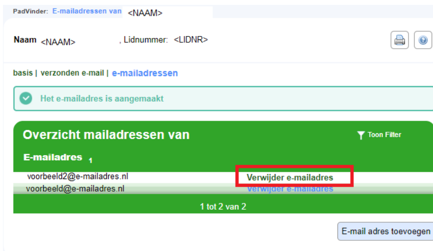
Afb. 6: e-mail adres verwijderen