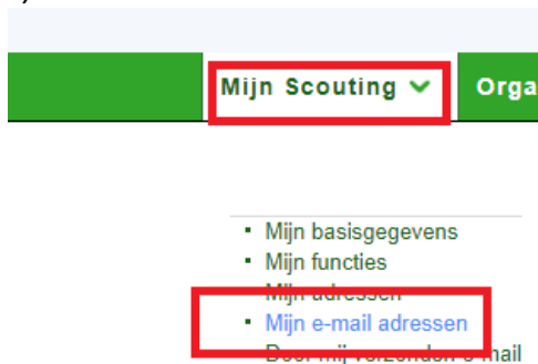
Afb. 3: kies voor 'Mijn email' of 'Mijn e-mail adressen'